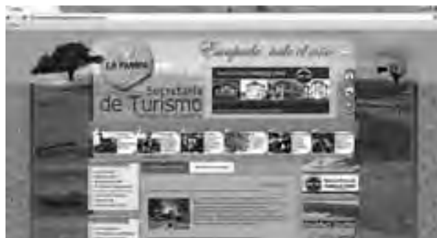
La nueva página Web sigue con el mismo dominio: www.turismolapampa.gov.ar

La Secretaría de Turismo de La Pampa, lanzó su renovado sitio web, de manera que los interesados en viajar a nuestra provincia, puedan tener mayor acceso a la información necesaria para organizar y disfrutar su viaje.