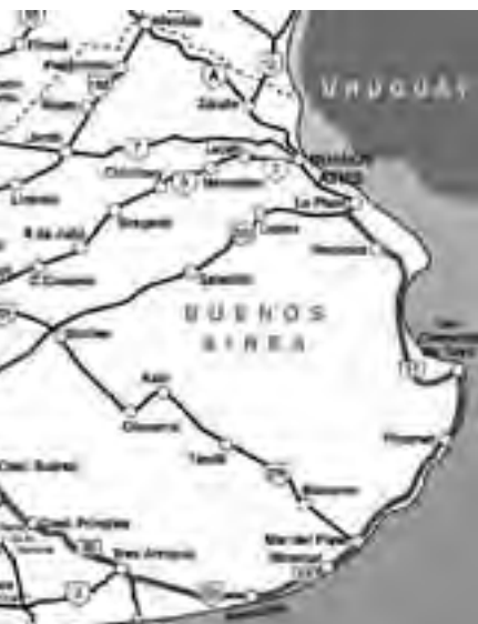
Esquema del recorrido elaborado por REGION®

- Utracán - Gral. Acha (Neutralización) - Puelches - Dique Casa de Piedra (Neutralización) - Gral. Roca - Neuquén Total: 540 kms. - Lunes 17 de octubre - 4° Etapa: Neuquén - Zapala (Neutralización) - Espinazo del Zorro - Rahue - Pilolil - Junín de los Andes - San Martín de los Andes Total: 415 kms. - Martes 18 de octubre : Descanso en San Martín de los Andes - Miércoles 19 de octubre - 5° Etapa: San Martín de los Andes - Junín de los Andes - Aluminé (Neutralización) - Cruce V. Pehuenia - Kilca - Primeros Pinos - Zapala (Neutralización) - Cutral Co - Plaza Huincul - Neuquén Total: 492 kms. - Jueves 20 de octubre - 6° Etapa A: Neuquén - Catriel (Neutralización) - Colonia 25 de mayo (Neutralización) - Santa Isabel - General Alvear (Neutralización) - Monte Coman (Neutralización) - San Luis Total: 769 kms. - Viernes 21 de octubre - 6° Etapa B: San Luis - Potrero de los Funes - Volcán - Trapiche - Dique La Florida - Trapiche. Total: 77 kms. Entrega Oficial de Premios. - Sábado 22 de octubre Fin de la carrera. Regreso controlado al ACA central con los mismos vehículos de organización, rescate y sanitarios que se desempeñaron durante todo el recorrido.