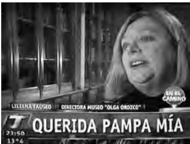
Otros entrevistados por Markic para su programa "En el camino".

Tras esta visita, quedó pendiente otra más en el futuro, para seguir abordando temas pampeanos de interés, que no son pocos.