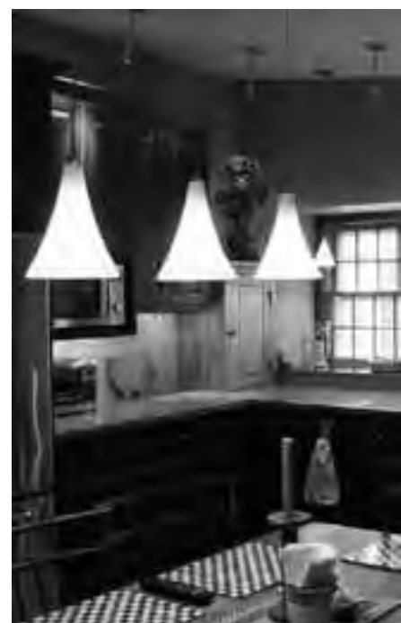
Al evitar en gran parte el cableado, ambientes que eran imposibles de automatizar hoy son posibles, en casas nuevas y antiguas.

Seguridad: Con este sistema se puede lograr "Simulación de Presencia": cuando una residencia se encuentra deshabitada. "Aviso de Alarma": cualquier movimiento extraño puede ser detectado. "Control de aberturas": detecta una