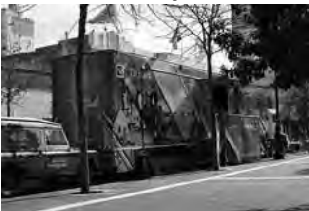
En su 1ra etapa, el Trailer visitó más de 40 localidades con 372.000 participantes.

"Hay un país que te falta conocer: Argentina".