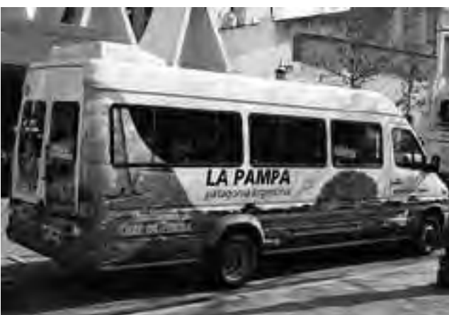
La Secretaría de Turismo de La Pampa, aprovechó la oportunidad para mostrar la nueva imagen de vehículos con temas de promoción turística y cultural.

También desde la SecTur se promocionó nuestra Provincia.