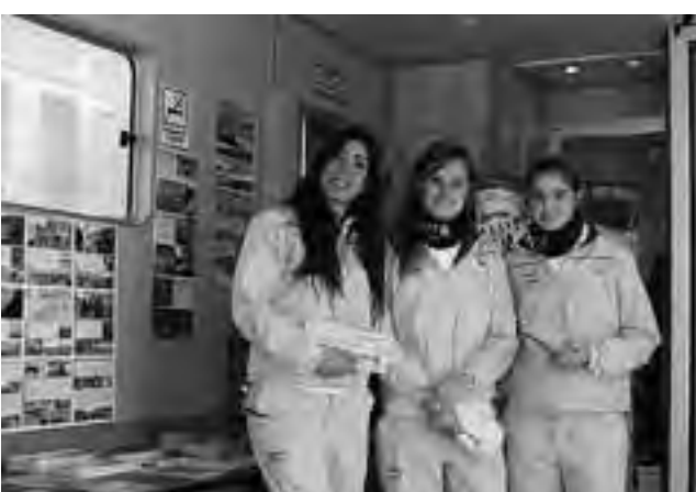
Las promotoras del Ministerio de Turismo de Nación, luego de venir desde La Plata a Santa Rosa, ahora seguirán con el Trailer Turístico por las ciudades de Neuquén, San Martín de los Andes y Bariloche, donde culmina esta gira.