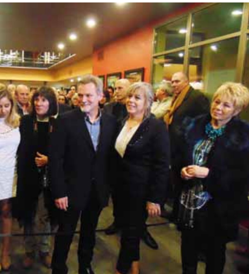
inaugural para el ingreso a la sala. En verdad se cortó una tira de película en celuloide.