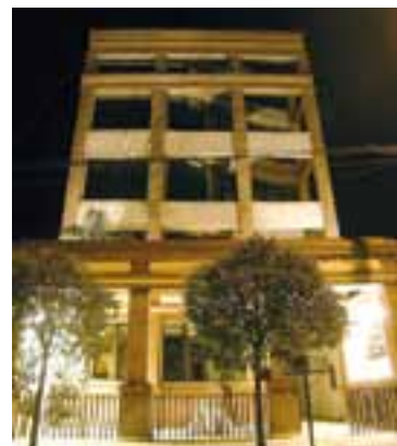
Lo que antes conocíamos como “CPIALP”, ahora deberá llamarse “CPITLP”, quedando por Ley como: Consejo Profesional de Ingenieros y Técnicos de La Pampa

Ver: http://www.lapampa.gov.ar/images/stories/Archivos/Bof/2015/PDF/Bof3186.pdf