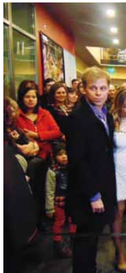
Instantes previos al “corte de cinta” in

Milenium está ubicado en calle Escalante entre Pico y Villegas y cuenta con una capacidad para 380 personas, “Tiene lo mejor del Don Bosco y lo mejor de Amadeus -dijeron sus dueños-. Y seguimos creyendo y dedicándonos a la cultura y el entretenimiento en Santa Rosa. Somos empresarios locales,