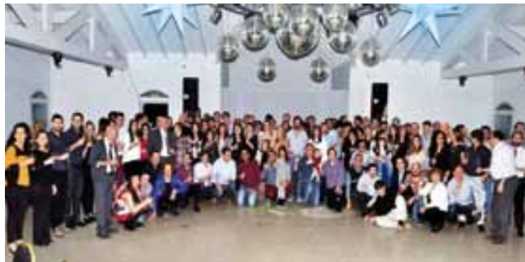
El viernes 1° de julio en el salón de eventos "El Palmar" de General Pico, la flamante Asociación de Arquitectos de La Pampa -dentro del marco de los festejos por el Día del Arquitecto Argentino-, celebró su 35° aniversario y la aprobación de la Ley de Colegiación Independiente ocurrida en diciembre pasado, entre otros importantes logros conseguidos. Más de 140 invitados de toda la provincia se hicieron presentes.

También dedicará su accionar al asesoramiento, a través de aportes y de críticas concretas, a instituciones intermedias, coo-