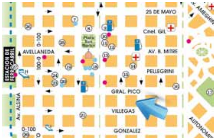
La ubicación de esta nueva sala de entretenimientos -a 450m de la Plaza San Martín-, permite que esta porción de la ciudad tome una nueva impronta. Su ubicación en calle Escalante 270, es muy próxima -250m- del Cine Don Bosco. (Santa Rosa Zona Centro: 14ª actualización "Mapa La Pampa REGION®")

Resuelto en doble altura, logra que el exterior ingrese y se integre con el interior, generando una serena transición entre el espacio abierto exterior y el espacio cerrado interior, acercando pro-