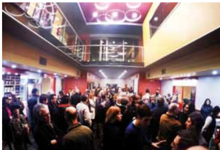
El público presente en los momentos previos al ingreso a la sala, colmó las instalaciones, en una noche inolvidable para muchos.

Av. Ameghino 444 - Santa Rosa, La Pampa Tel: 02954-419090 estudiotuerosmoran@gmail.com