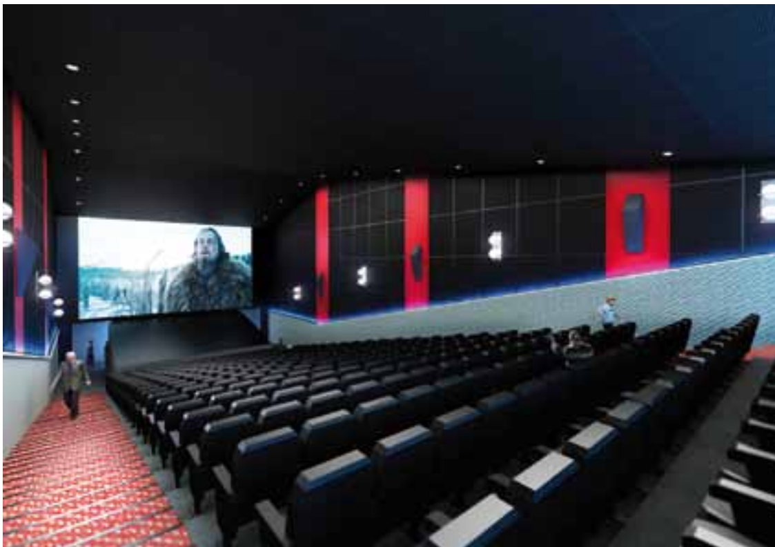
La sala de "Milenium" tiene un moderno e innovador diseño, por el cual se ingresa a la misma, pasando por debajo de la pantalla de alta luminosidad, de pared a pared, con sonido digital 360° Dolby 7.1. Esta sala de cine cuenta con 376 butacas y es del tipo Stadium, que garantiza la visibilidad en toda ubicación. (renderización de estudio Tueros Morán AA)

gresivamente al público hacia la serenidad ambiental, que sugiere el espectáculo cinematográfico y que requiere el cinéfilo.