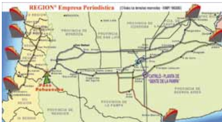
Sin lugar a dudas, en el caso de la posibilidad de exportar contenedores por vía terrestre a Chile y desde el Océano Pacífico hacia destinos asiáticos, pasa a jugar un rol de gran importancia el Paso Internacional del Sistema Pehuenche, el Corredor Bioceánico más cercano que tiene la provincia de La Pampa.

Apuntamos fundamentalmente al mercado local aunque también vemos viable la exportación terrestre a Chile y desde el Pacífico a Asia en el segmento de los contenedores. Para que esta nueva planta de soja exista fue necesario la conjunción de capitales de la propia empresa, financiamiento del gobierno provincial y fundamentalmente el esfuerzo de todas las personas que integran Gente de La Pampa", revelaron.