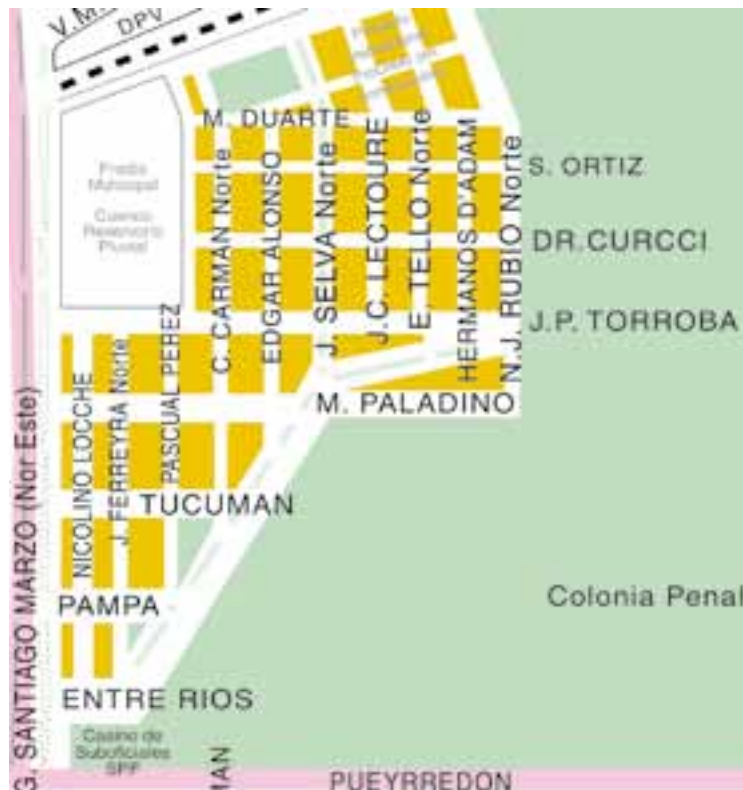
Barrio ProCreAr Santa Rosa (13° actualización "Guiaplano REGION®")

Un grupo de vecinos de la ciudad de Santa Rosa, beneficiarios del proyecto de urbanización del programa ProCreAr, cuya obra tiene sede sobre la Avenida Circunvalación Este, en la zona Lindera al Barrio Santa María de La Pampa, solicitaron por medio de una nota enviada a los medios de comunicación, poder tener novedades respecto a la fecha de entrega de esas viviendas, prometidas para abril de 2015, es decir hace ya más de un año.