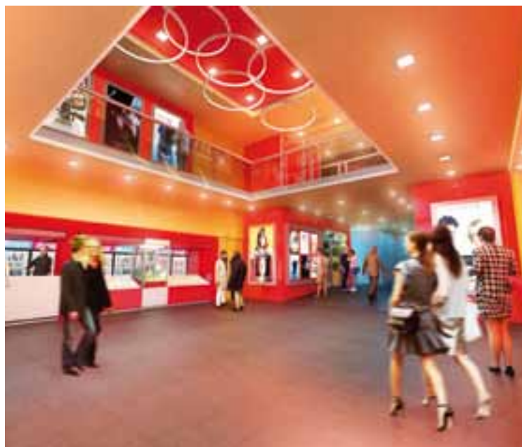
Amplio Hall -Foyer- de "Milenium", en doble altura, donde se accede a los servicios de golosinas y acceso a baños. (renderización de estudio Tueros Morán AA)

De esta manera Cine Milenium , pretende ponerse a la altura de las circunstancias, devolviendo a la Ciudad, todo lo que ella le ha dado en estos últimos 20 años.