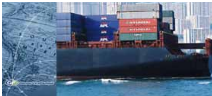
Los principales destinos de exportaciones de "Gente de La Pampa" son: Chile, Brasil, Colombia, Venezuela, Antillas Holandesas, África, entre otros.

producción de la zona, tengamos en cuenta -para tomar dimensión- que actualmente en la provincia de La Pampa se procesa el 5% del poroto de soja que se produce en suelo pampeano y esta planta elevaría al 25% ese proceso, generando valor agregado a la producción agrícola local y dando la posibilidad de generar puestos de trabajo", subrayaron.