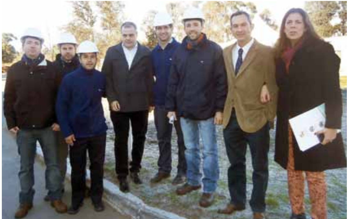
Personal profesional de la empresa que acompañó las visitas guiadas a una concurrencia aproximada de 500 personas

En este sentido explicaron en una recorrida guiada por las instalaciones, que la unidad de nutrición animal tiene una capacidad de procesamiento de hasta 80.000 toneladas por año, lo que implica que “Gente de La Pampa industrialice el producto primario evitando costos logísticos y garantizando la calidad Hi Pro, este proceso viene a completar un eslabón absolutamente necesario para continuar con la cadena de valor de la soja de nuestra Provincia”, manifestaron.